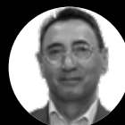
Javier Fernández de la Peña

Presidente Ejecutivo de Talento-EPHOS. Expresidente de Pfizer.