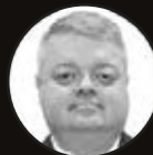
MIGUEL ÁNGEL ANGUITA

Presidente Ejecutivo de Talento-EPHOS. Expresidente de Pfizer.