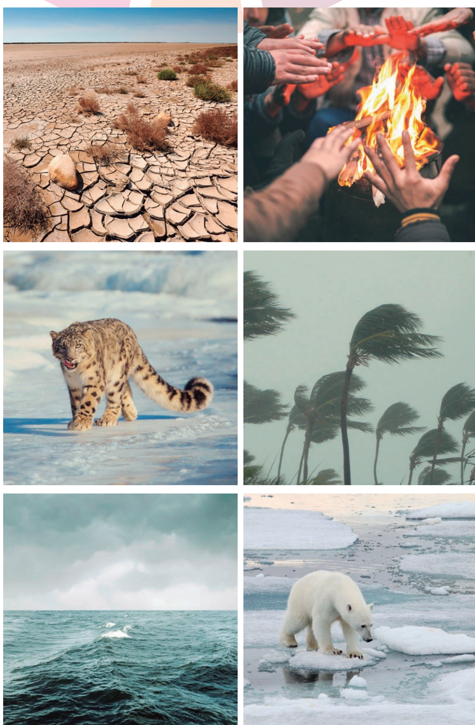
Figura 1. Principals efectes ambientals observats i esperats pel canvi climàtic.

Aquest augment global de la temperatura porta conseqüències desastroses que posen en perill la supervivència de la flora i la fauna de la Terra, inclòs l'ésser humà. Entre d'altres impactes negatius associats al canvi climàtic destaquen la desaparició de molts ecosistemes, l'augment de les àrees de desertificació, el desgel dels pols i, com a conseqüència, la pujada del nivell del mar, l'acidificació dels oceans, fenòmens meteorològics extrems com huracans i pluges tropicals i l'extinció d'espècies. Tots aquests impactes provoquen desplaçaments de poblacions humanes (Figura 1).