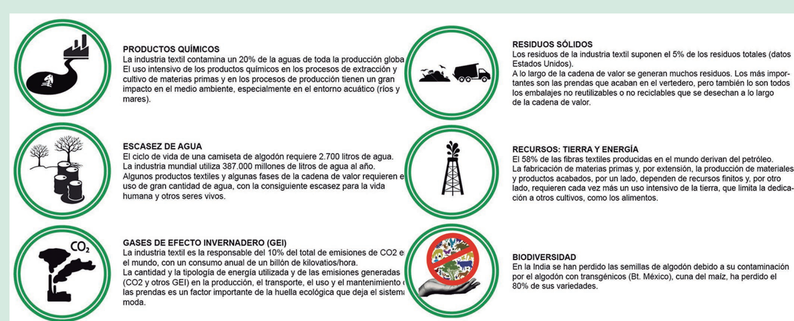
Figura 2. Salcedo, E. (2014), Moda ética para un futuro sostenible, Editorial Gustavo Gili.

La indústria de la moda presenta un patró de producció d'enorme impacte mediambiental (Figura 2).