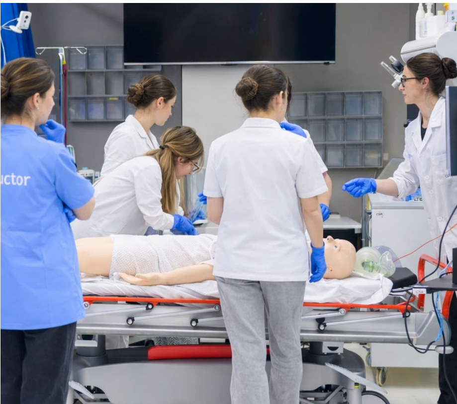
Suport vital avançat