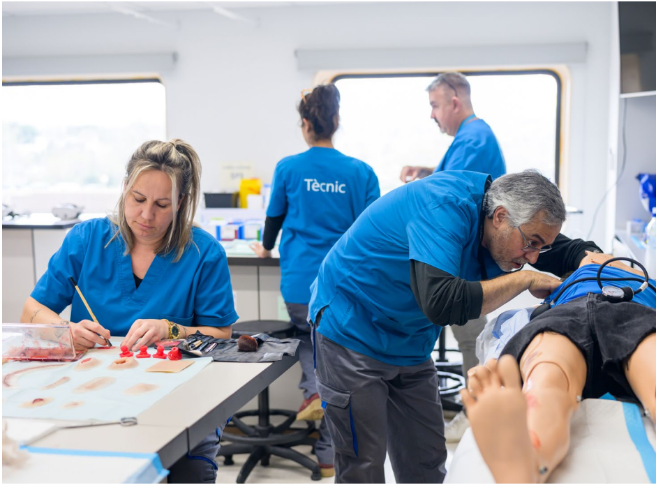
Caracterització de maniquins