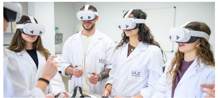
Simulación con realidad virtual