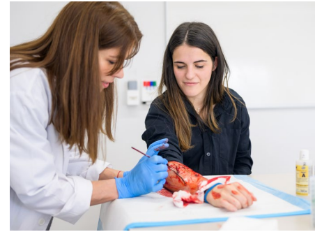
Creación de heridas con moulage