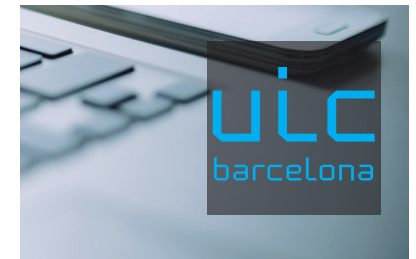
Logotipo 100 % cian. Pastilla negro con un 60 % de transparencia.