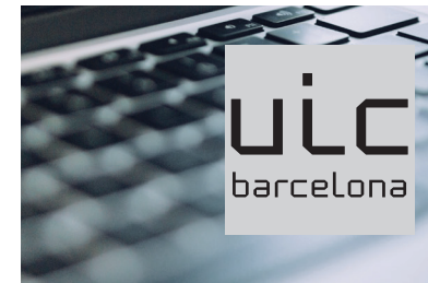
Logotipo 100 % negro. Pastilla 20 % negro.