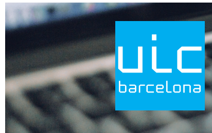
Logotipo en negativo. Pastilla 100 % cian.

Este recurso no hay que confundirlo con el área de respeto.