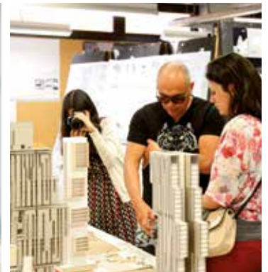
TFG ganador del Premio Schindler España 2018